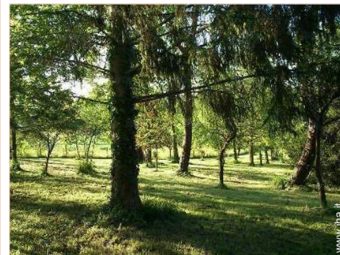
vista dalla proprietà