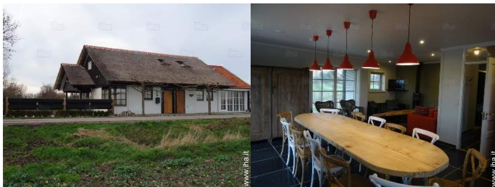
Casa di Prestigio