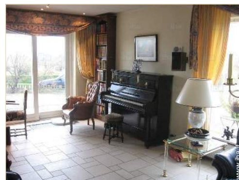
cucina in stile americano