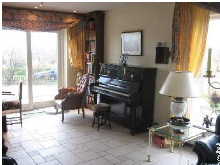
cucina in stile americano