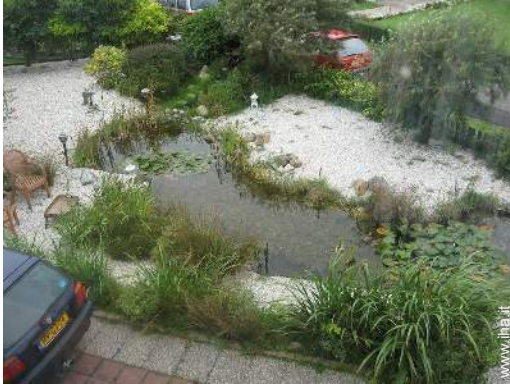
vista sul giardino/parco