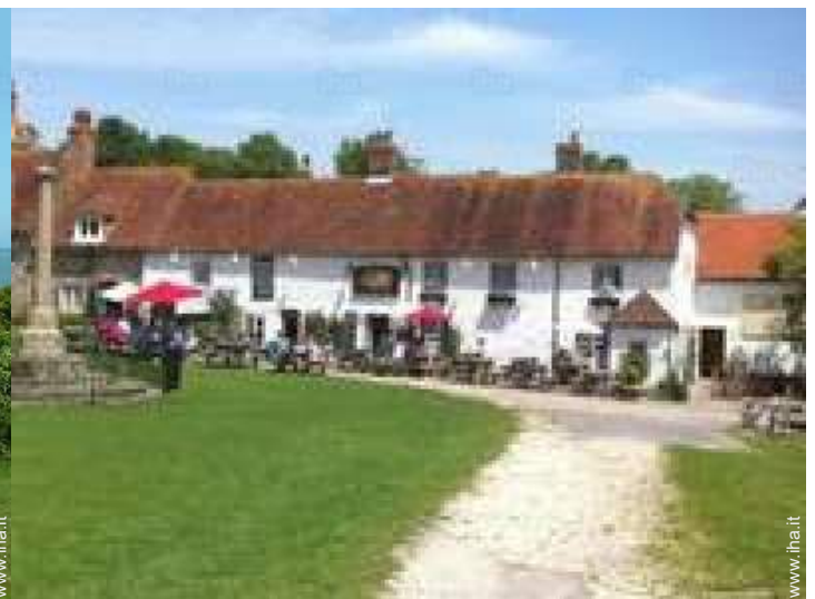
Città nelle vicinanze