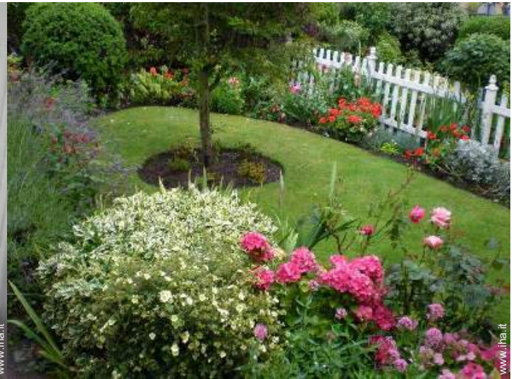
vista sul giardino/parco