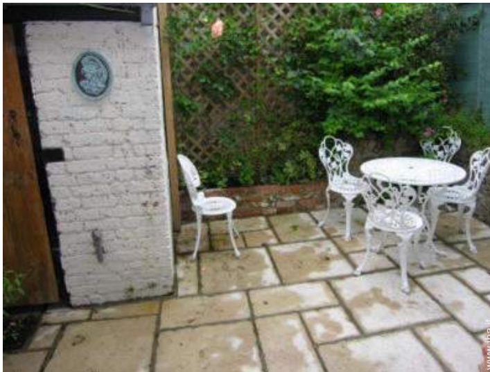
vista sul cortile