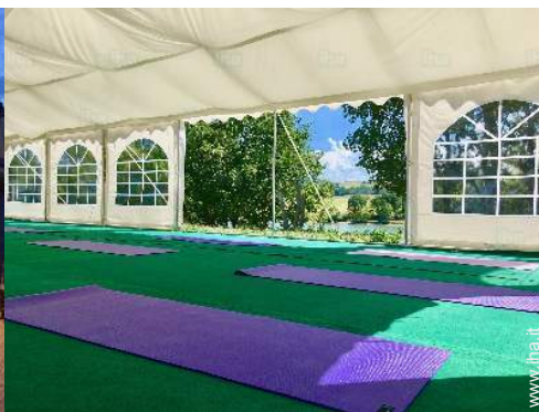
vista sulla campagna