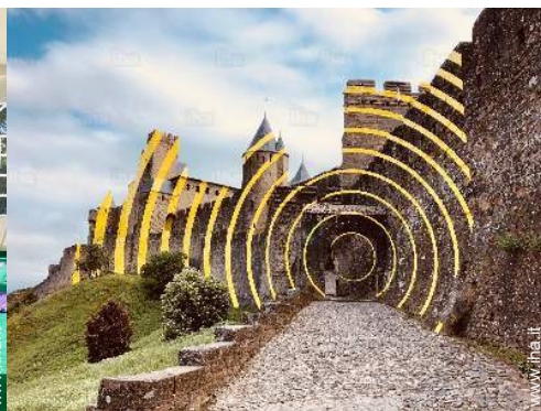
Attrazioni e relax