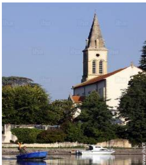
vista sul fiume