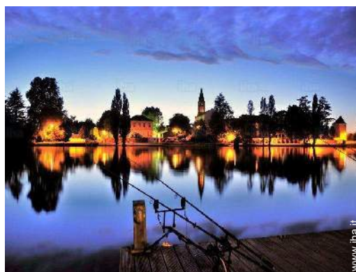
vista sul fiume