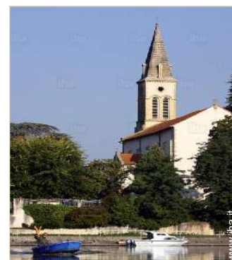
vista sul fiume