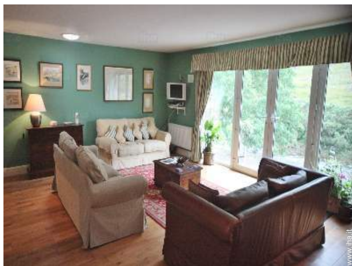
vista dal salone