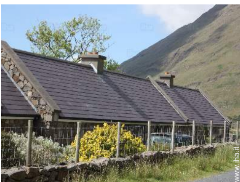
Casa in Pietra di Charme