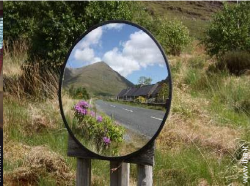
Proprietà di Charme