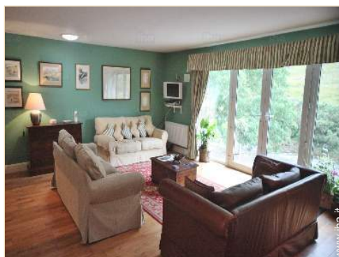
vista dal salone