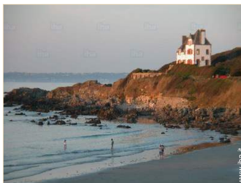
accesso diretto alla spiaggia