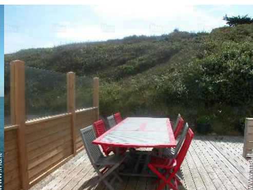
vista dalla cucina