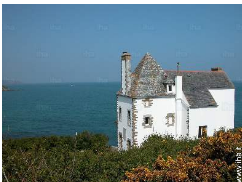
vista sul mare