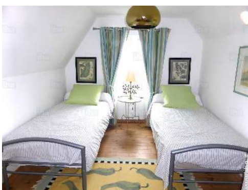
camera per ragazzi