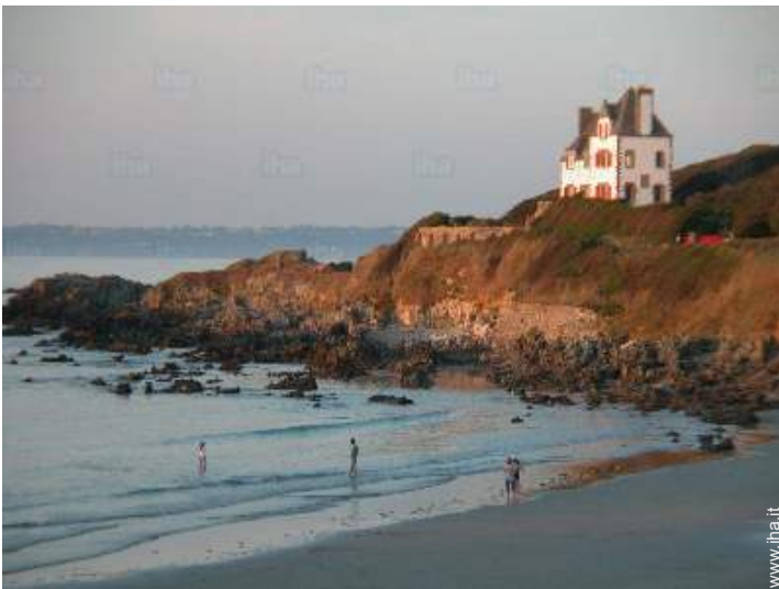
accesso diretto alla spiaggia