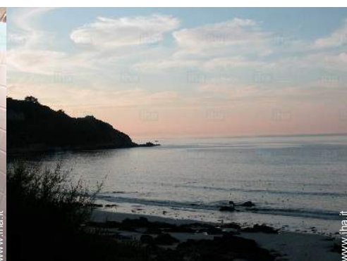
vista sul tramonto