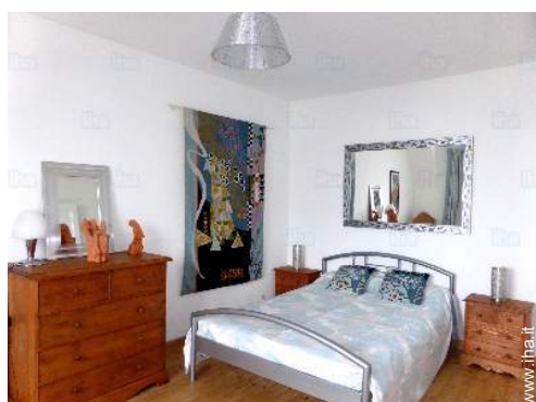
stanza degli ospiti