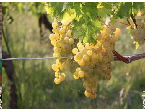
cantina e degustazione di vino