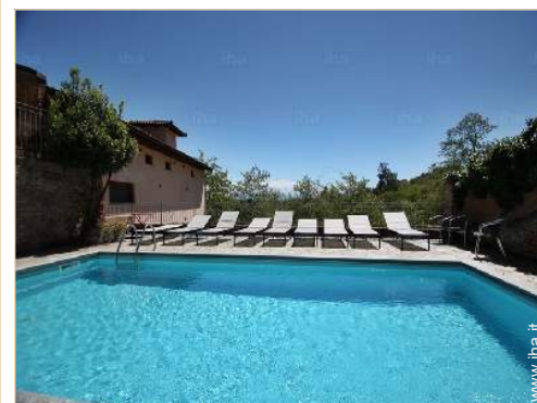
piscina in comune