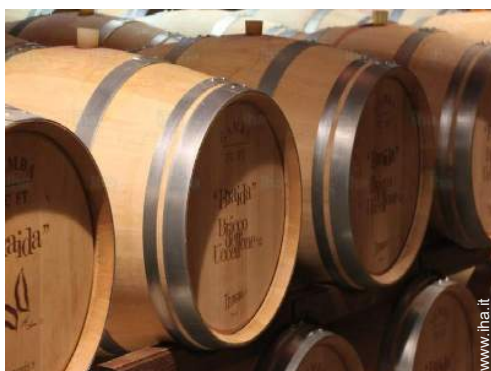
cantina e degustazione di vino