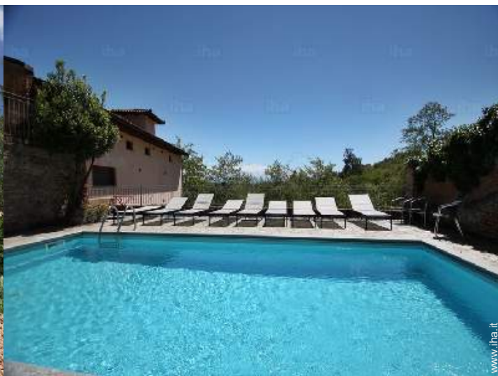
piscina in comune