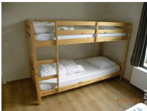
letti a castello