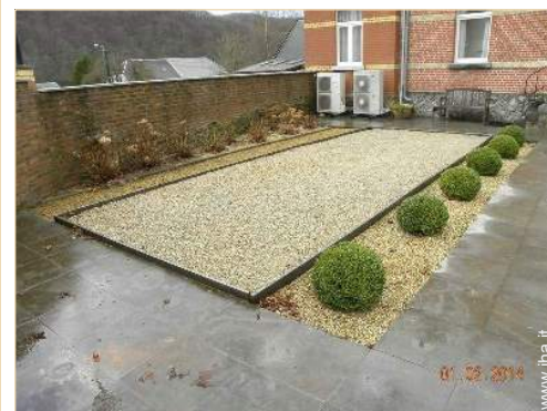
campo di bocce