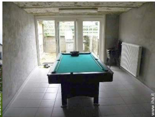
tavolo da biliardo