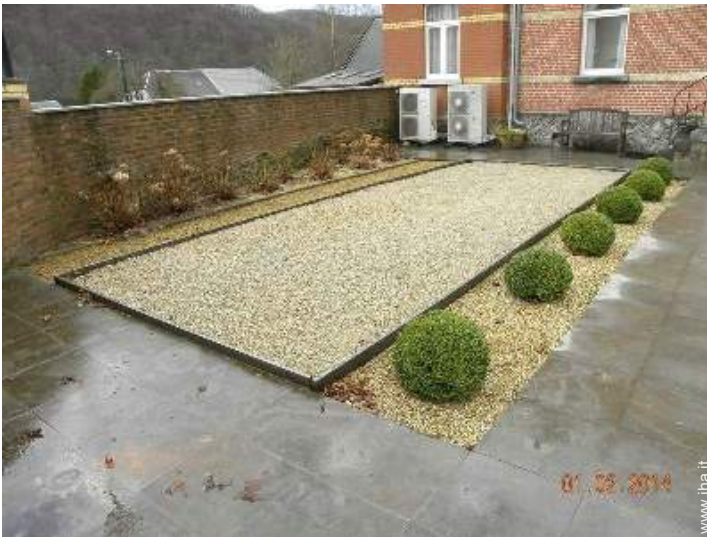
campo di bocce