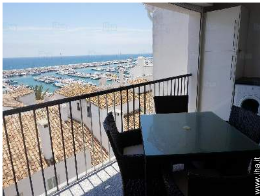
vista dal terrazzo coperto