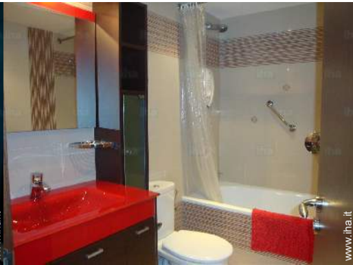
luogo per bagnarsi