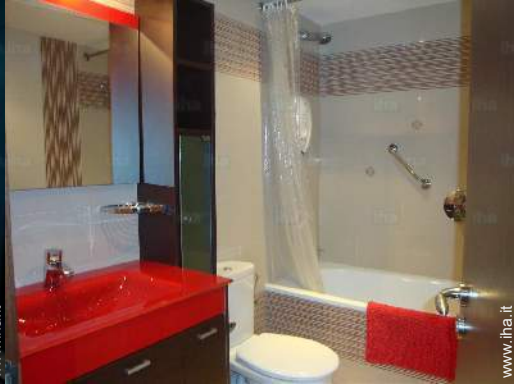
luogo per bagnarsi