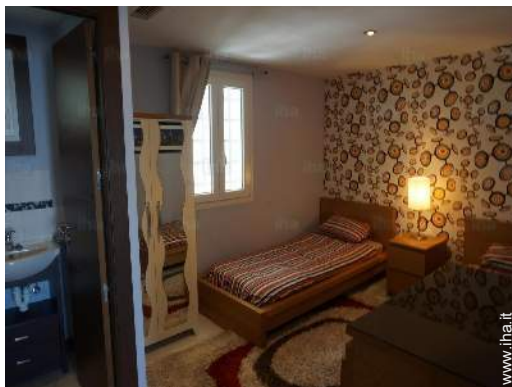
stanza degli ospiti