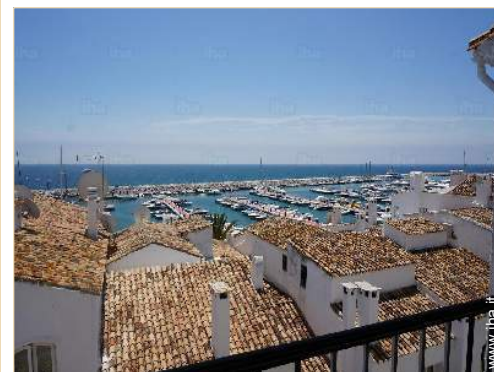
vista dal terrazzo coperto

Piscina riscaldata Mare/oceano <50m Spiaggia 100m Spiaggia dei nudisti 20km Piscina pubblica Campo da tennis pubblico Percorso di golf 9 buche Percorso di golf 18 buche Centro nautico Lago 7,5km Foresta 30km Marina