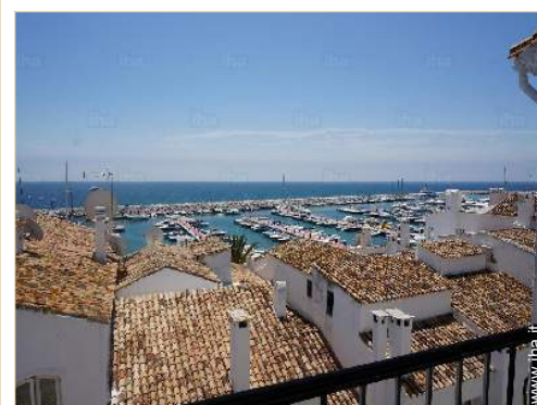
vista dal terrazzo coperto

Noleggio barche Panetteria Traiteur Negozi tipici <50m Supermercato <50m Negozi di alta classe e di lusso <50m Salone di coiffure <50m Ufficio postale Banca 50m Distributore automatico di biglietti Farmacia Medico Infermiera Ospedale