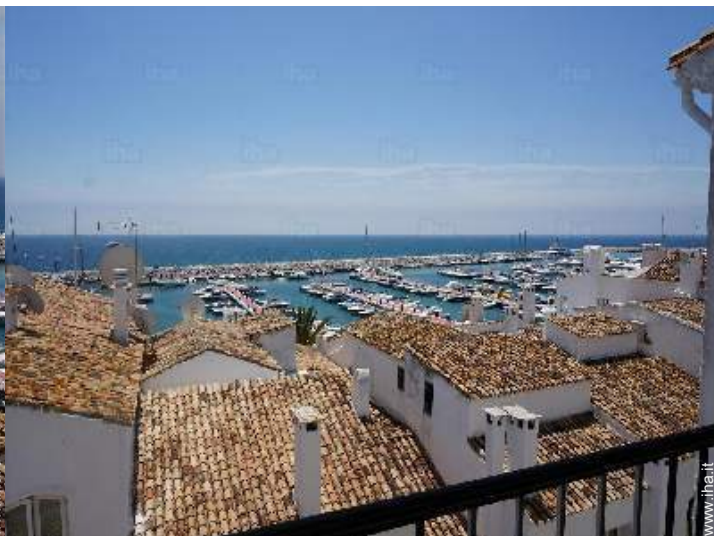
vista dal terrazzo coperto