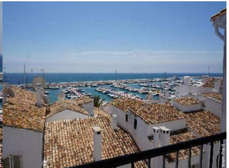
vista dal terrazzo coperto