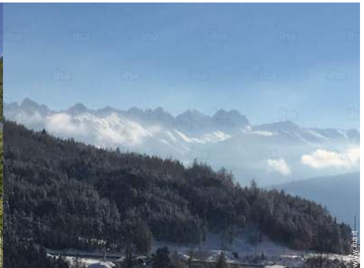
vista sulla montagna