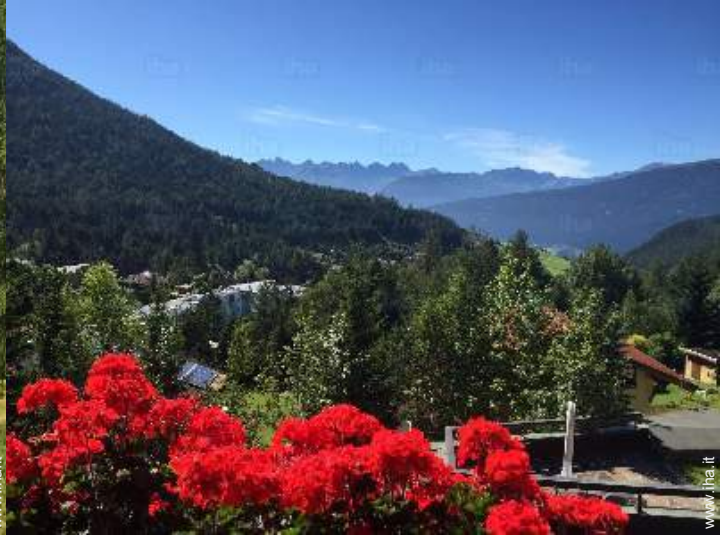
vista sulla montagna