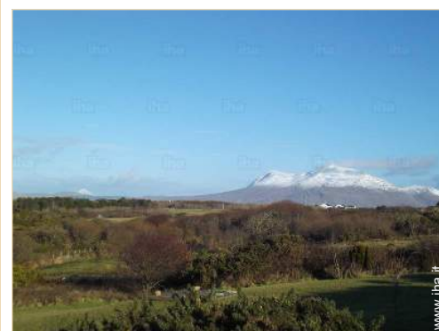
vista sulla campagna

Villaggio centro 2km Noleggio biciclette/mountain bike 5km Affitto materiale di immersione 5km Negozi tipici 2km Supermercato 2km Ufficio postale 2km