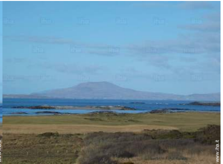
vista dalla sala da pranzo