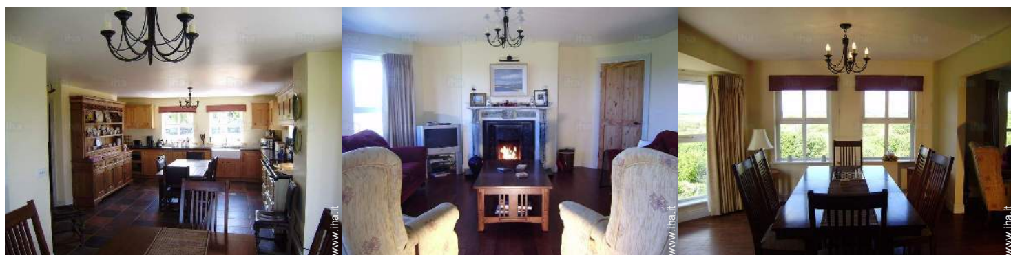
grande cucina indipendente