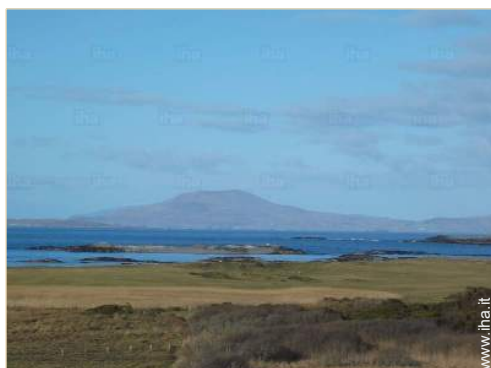
vista dalla sala da pranzo