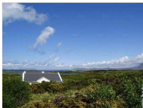
vista sul lago