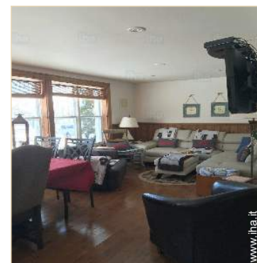
vista dalla sala da pranzo