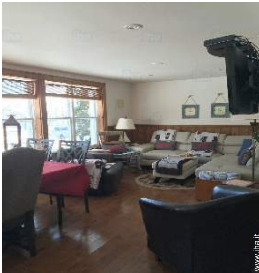
vista dalla sala da pranzo