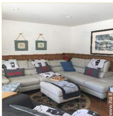
salone con televisore