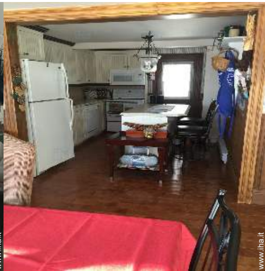
grande cucina indipendente