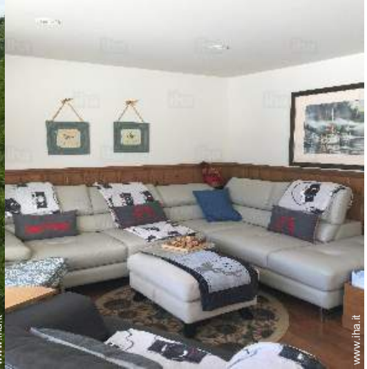
salone con televisore