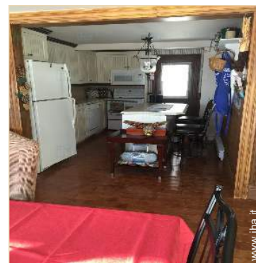
grande cucina indipendente

Villaggio centro 1,5km Centro città 50km Noleggio auto 50km Panetteria 2km Traiteur 25km Negozi tipici 1,5km Supermercato 40km Negozi di alta classe e di lusso 50km Salone di coiffure 40km Ufficio postale 15km Banca 25km Distributore automatico di biglietti <50m Farmacia 30km Medico >50km Infermiera >50km Ospedale 50km Ambulatorio >50km