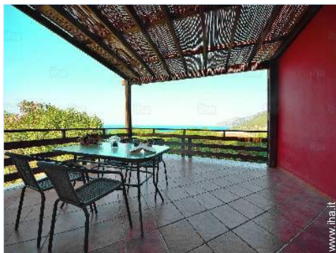
vista dalla veranda