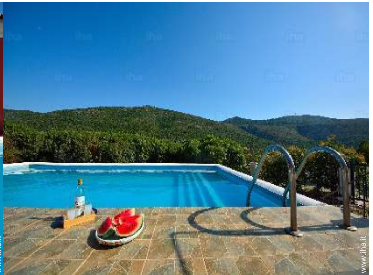
vista dalla piscina