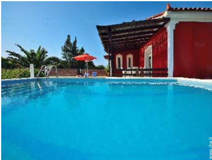
vista dalla piscina