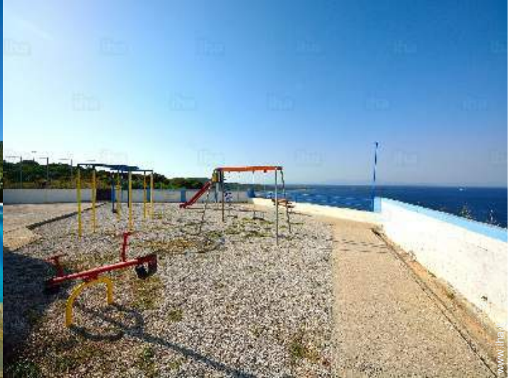
disposizione delle attrezzature ricreative