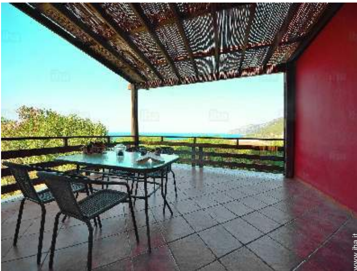
vista dalla veranda