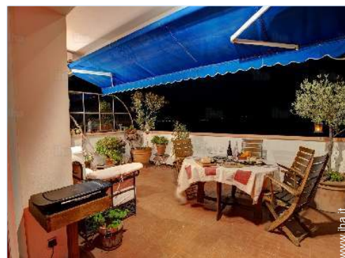
Comfort interno ed attrezzature

Salotto estivo, barbecue, tavolo da giardino, sedia(e) da giardino, carrello, salotto da giardino, chaise(s) longue(s), amaca(che)