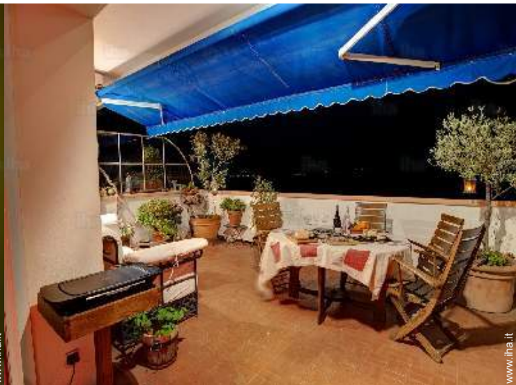
Comfort interno ed attrezzature