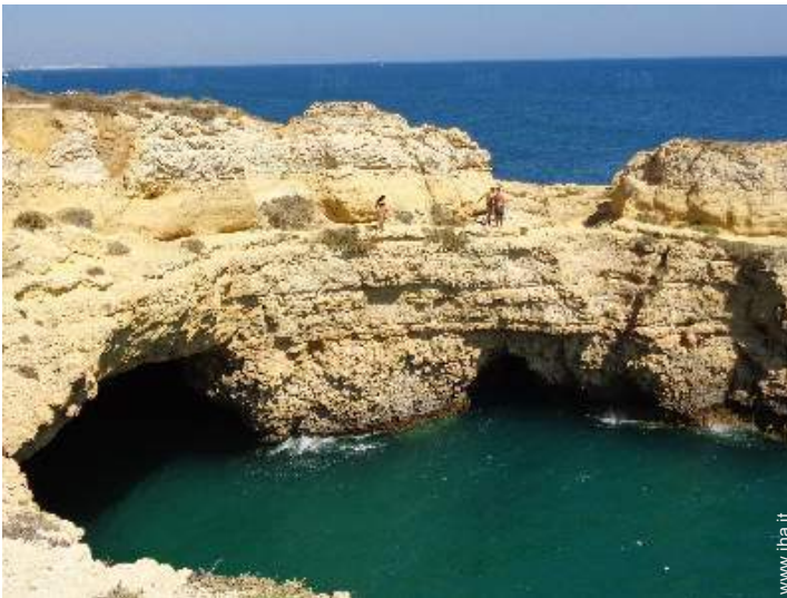
attrezzature ricreative nelle vicinanze