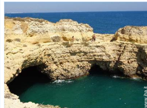
attrezzature ricreative nelle vicinanze