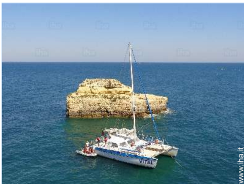
sport estivi nelle vicinanze

" Casa al piano terra è composto da 1 camera da letto con letto matrimoniale, tv, divano-letto, 1 bagno con doccia, cucina con fornelli, forno, Frigorifero, forno a microonde e lavandino. L'esterno ha una stufa, tavolo e sedie per un corretto pasti all'aperto. Lotto di parcheggio "