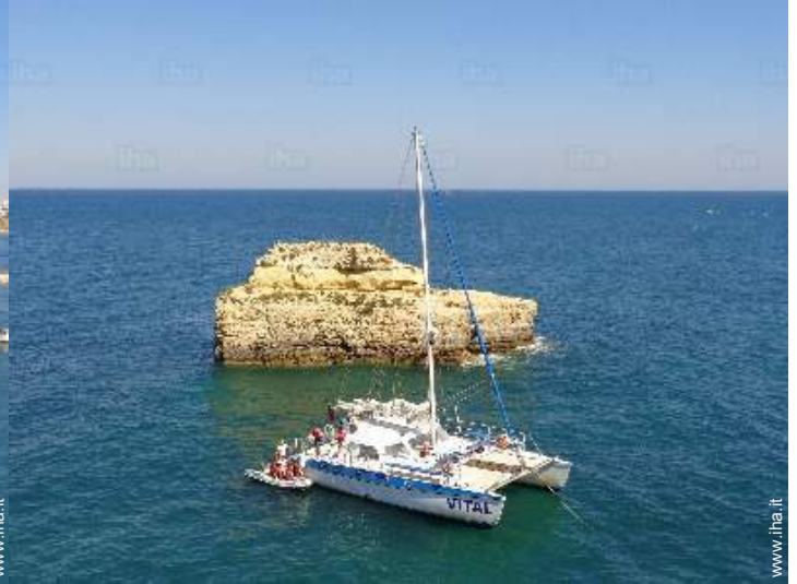
sport estivi nelle vicinanze