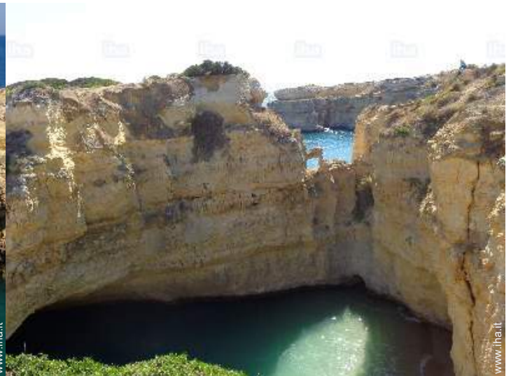
attività di volo nelle vicinanze