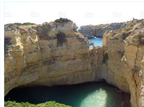
attività di volo nelle vicinanze

Fermata/stazionamento bus 300m Traiteur 200m Supermercato 200m Salone di coiffure 500m Distributore automatico di biglietti 200m Farmacia 1km