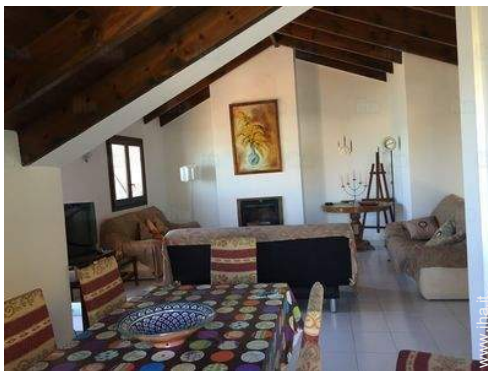
sala da pranzo