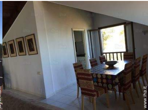
sala da pranzo