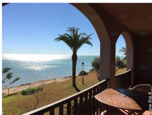
vista dal terrazzo

Privilegi : Accesso diretto alla spiaggia