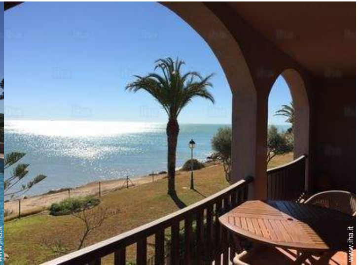
vista dal terrazzo