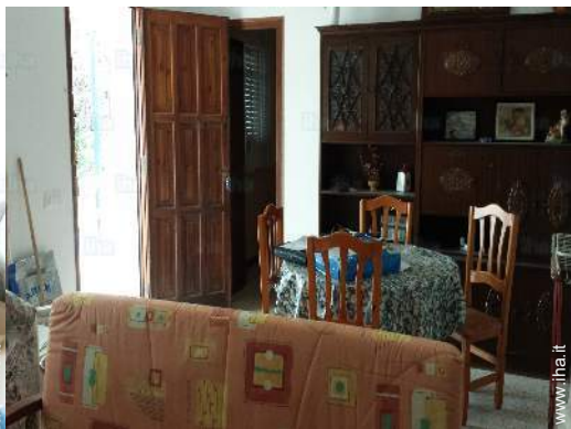
vista dal salone