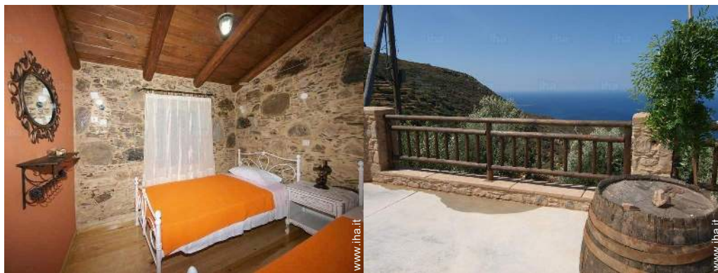
vista sul mare