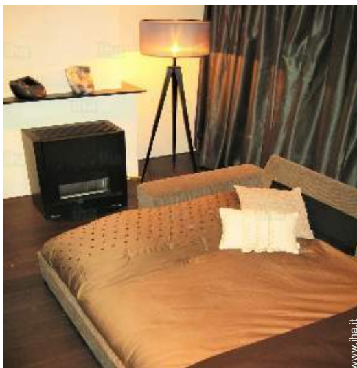
divan(i) letto 2 pers