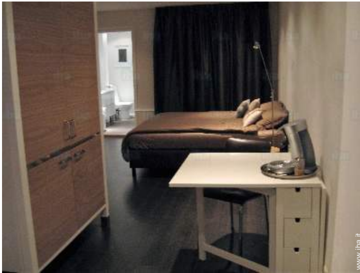
vista dalla cucina