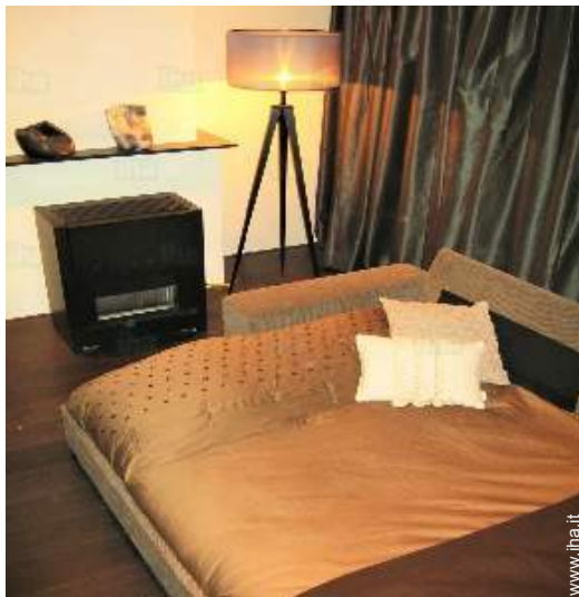
divano(i) letto 2 pers