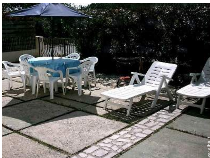
tavolo da giardino