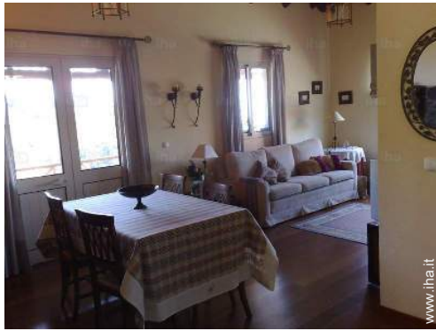
vista dalla sala da pranzo