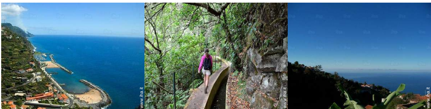
luogo per bagnarsi