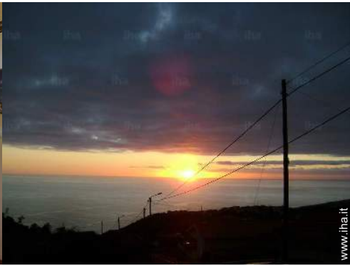
vista sul tramonto