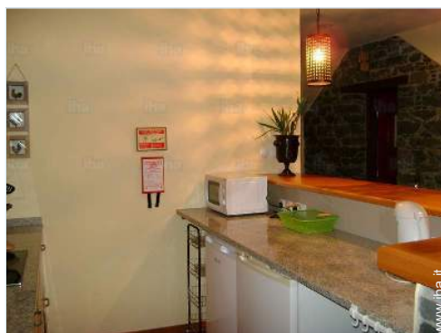
cucina in stile americano

Dotazioni per i diversamente abili : motoria