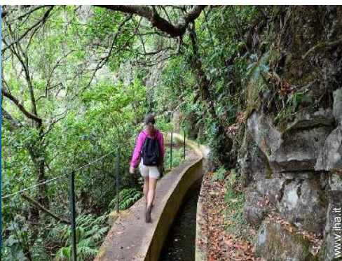
attività montane nelle vicinanze