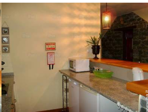
cucina in stile americano