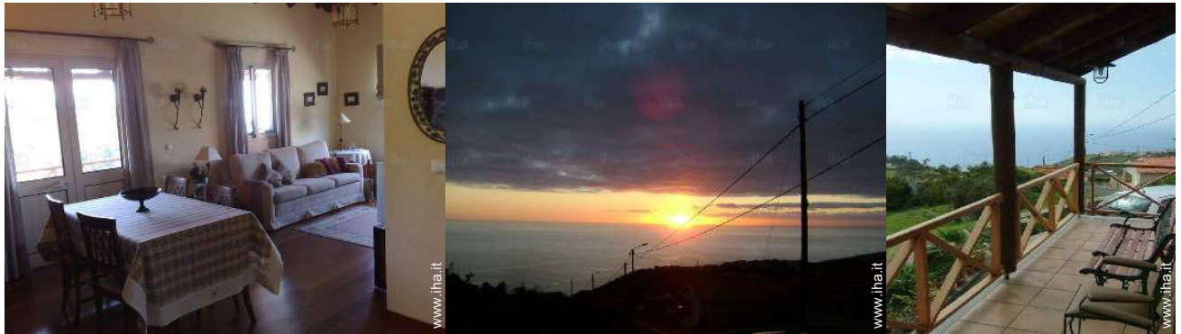
vista dalla sala da pranzo