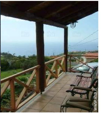
vista sul mare