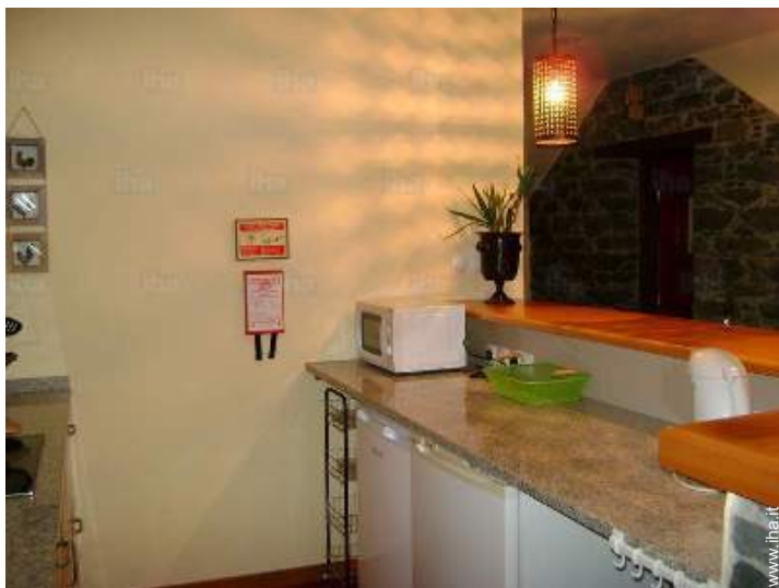
cucina in stile americano