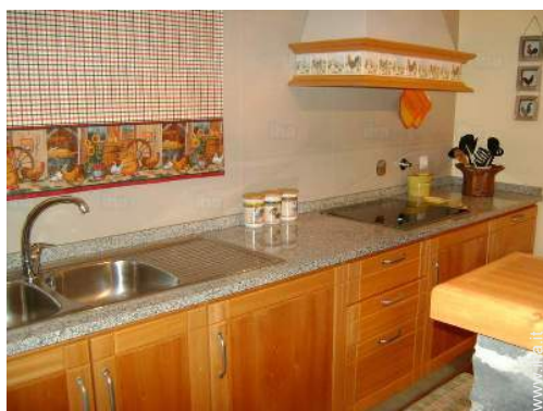
cucina in stile americano