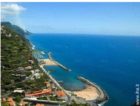
luogo per bagnarsi