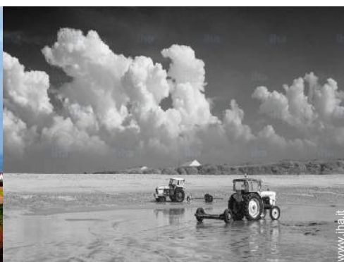
vista sul mare