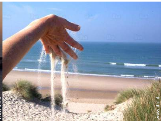
Attrazioni e relax