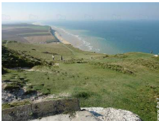
attrezzature ricreative nelle vicinanze