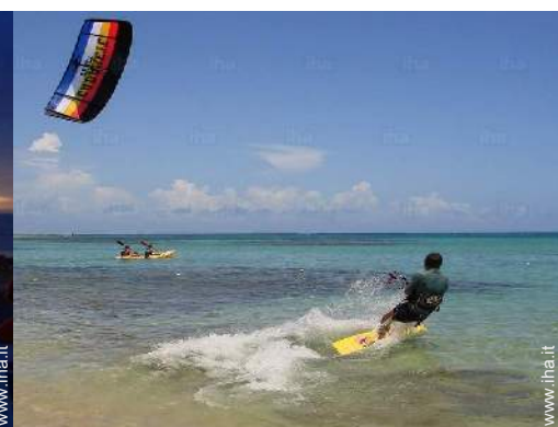
sport acquatici nelle vicinanze