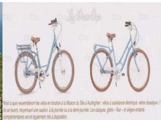
percorso per mountain bike