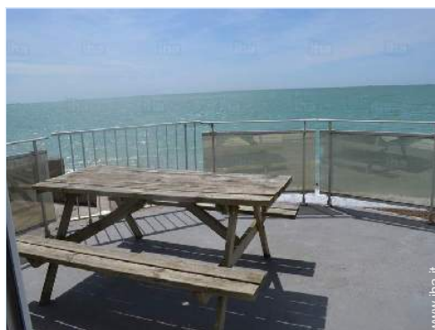
vista dal terrazzo