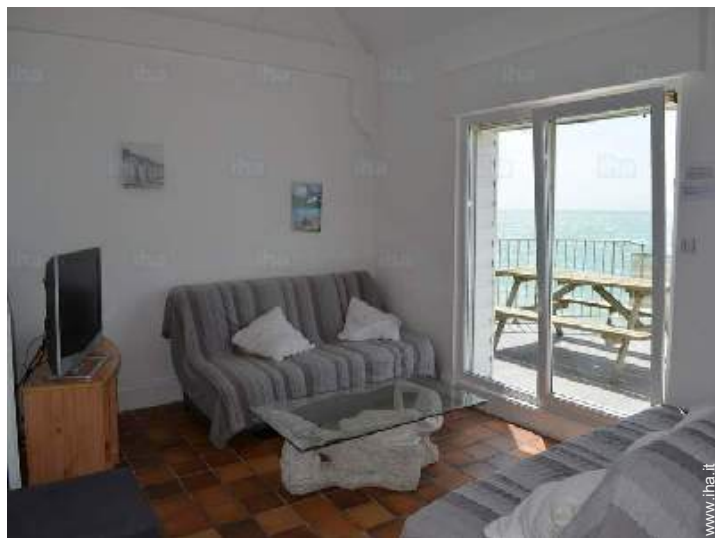
salone con televisore