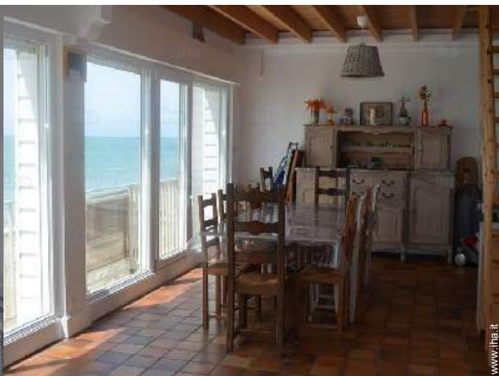
sala da pranzo