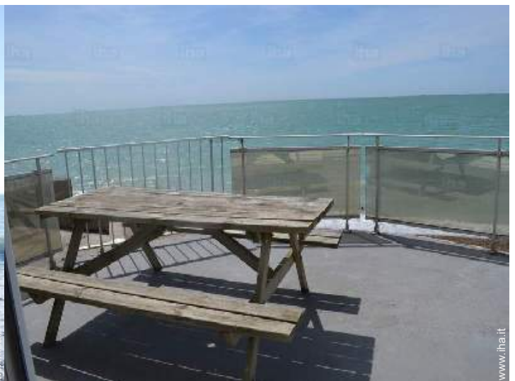
vista dal terrazzo