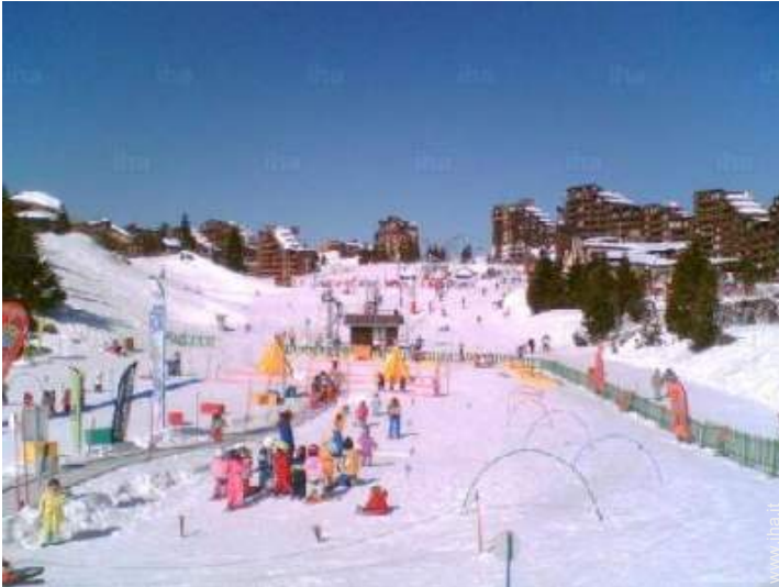
giardino delle nevi per bambini