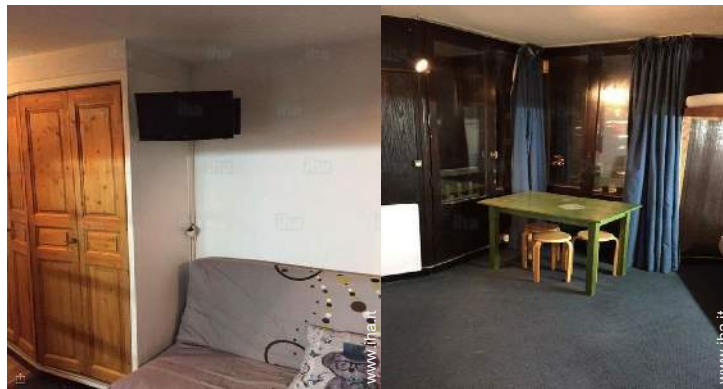
Disposizione interna e comfort