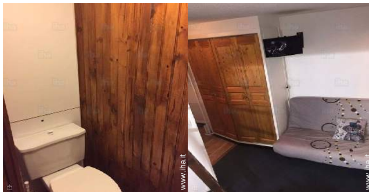
divano(i) letto 2 pers