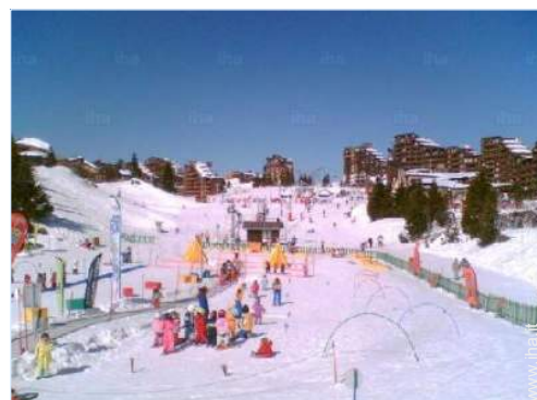
giardino delle nevi per bambini