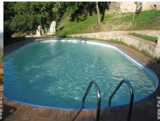
vista dalla piscina