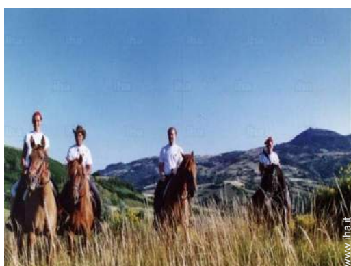
scuola di equitazione