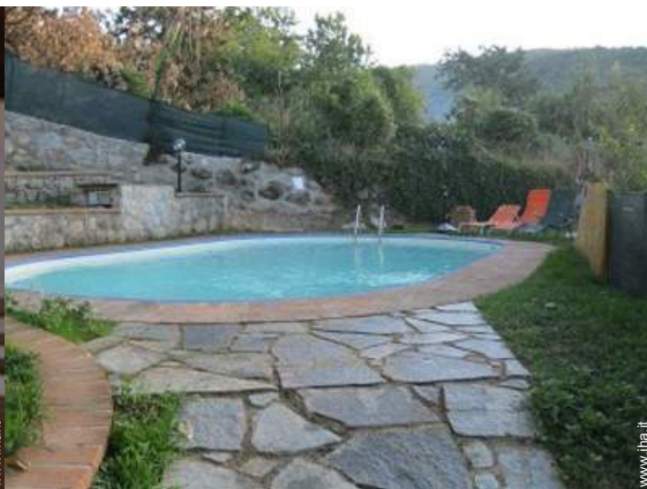
vista dalla piscina