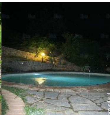
sistema di illuminazione