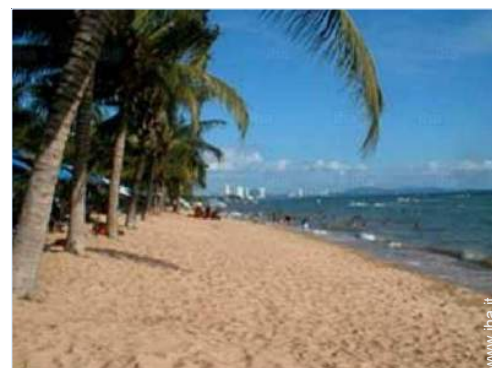
attività balneari nelle vicinanze