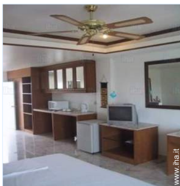
ventilatore a pale da soffitto