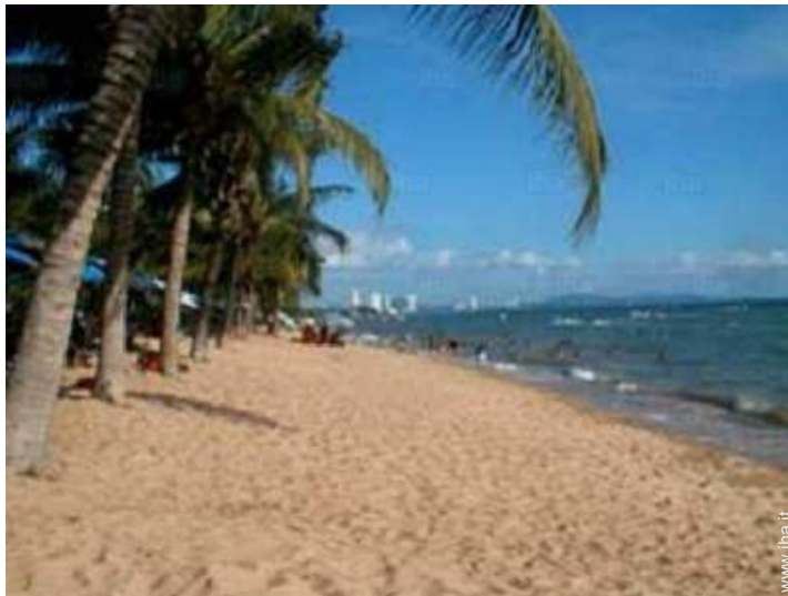
attività balneari nelle vicinanze