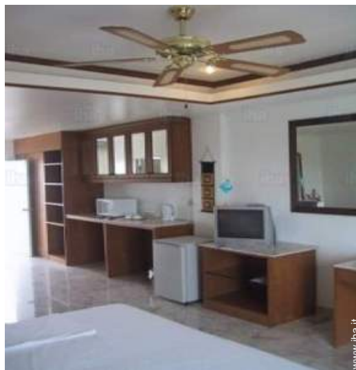
ventilatore a pale da soffitto