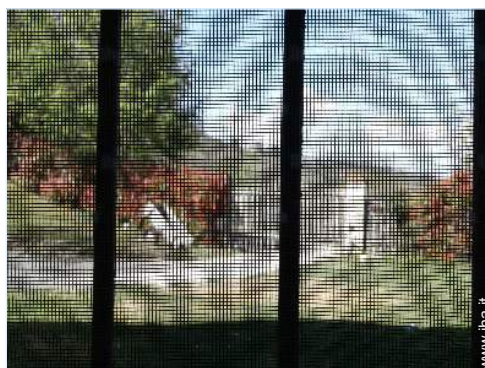
zanzariera per finestre