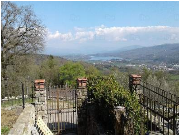
vista sul lago