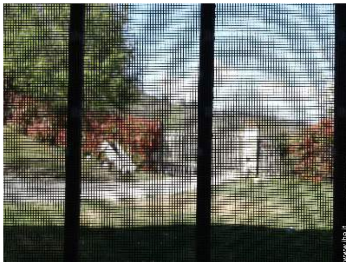
zanzariera per finestre