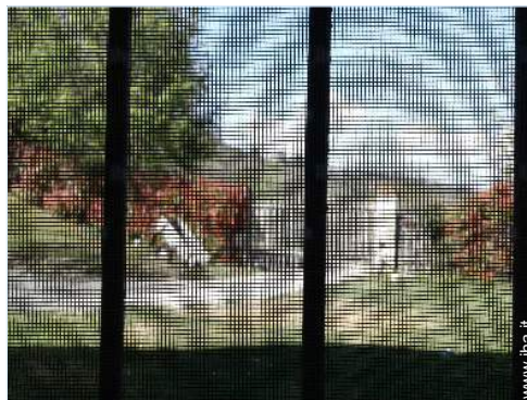
zanzariera per finestre