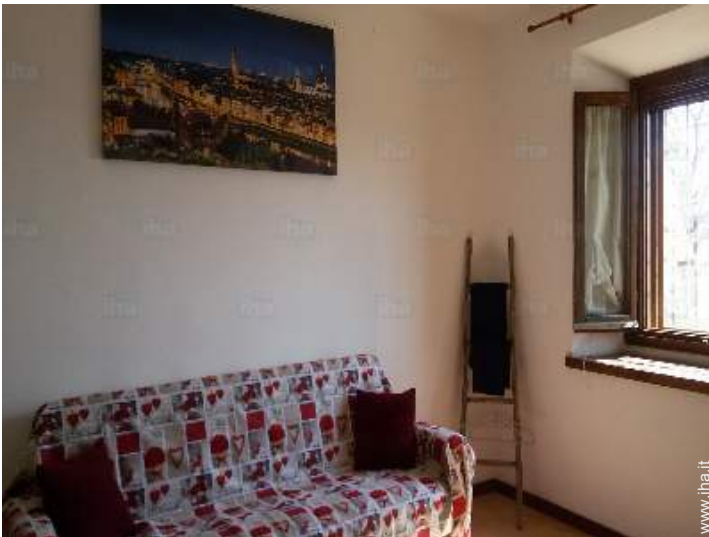
divano(i) letto 2 pers