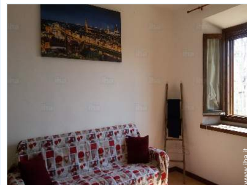
divano(i) letto 2 pers

Panetteria 4km Negozi tipici 4km Supermercato 4km Negozi di alta classe e di lusso 2,5km Ufficio postale 4km Banca 4km Farmacia 4km Ospedale 15km