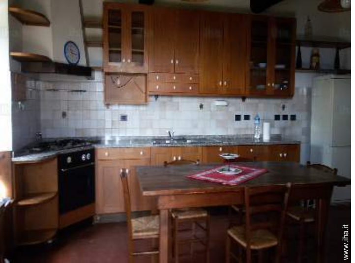
vista dalla cucina