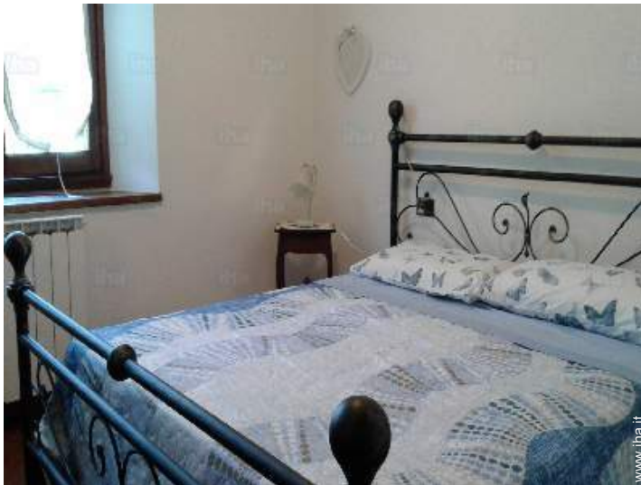
vista dalla camera