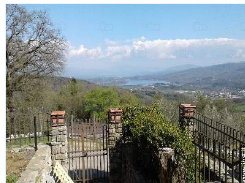
vista sul lago

Tavolo da giardino, 6 sedia(e) da giardino, ombrellone