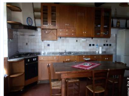
vista dalla cucina