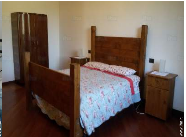
vista dalla camera