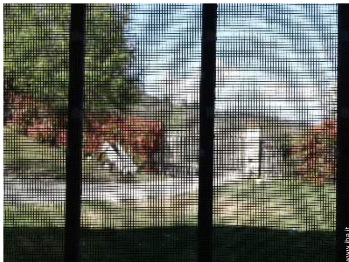
zanzariera per finestre