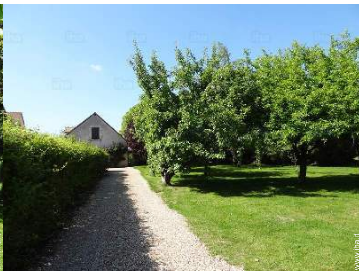
vista dal giardino/parco