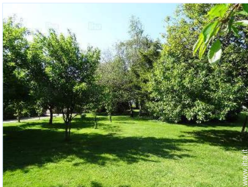
vista dal giardino/parco