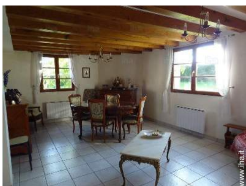
sala da pranzo