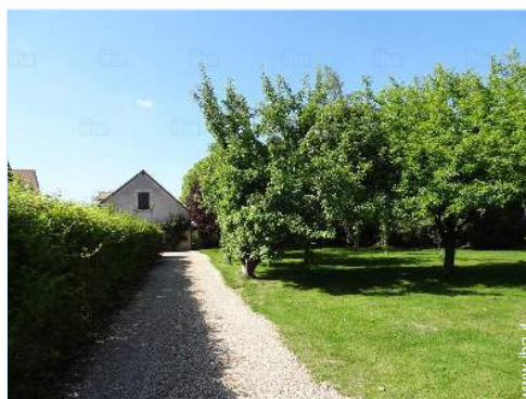
vista dal giardino/parco