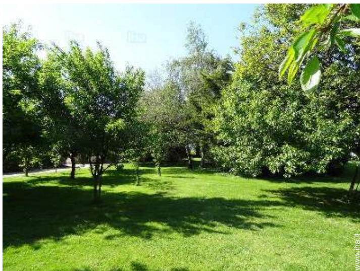
vista dal giardino/parco