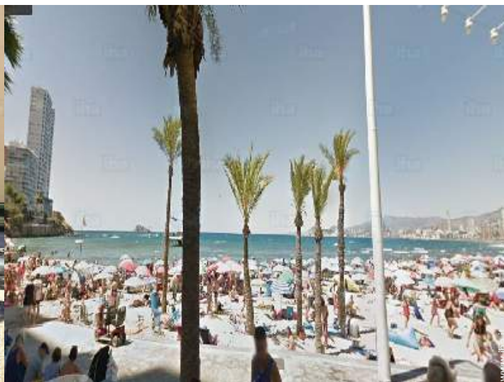
attività di volo nelle vicinanze