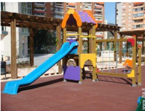
parco e giardino