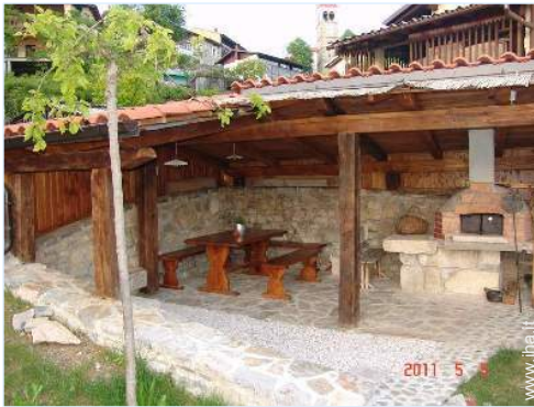
forno per pizze