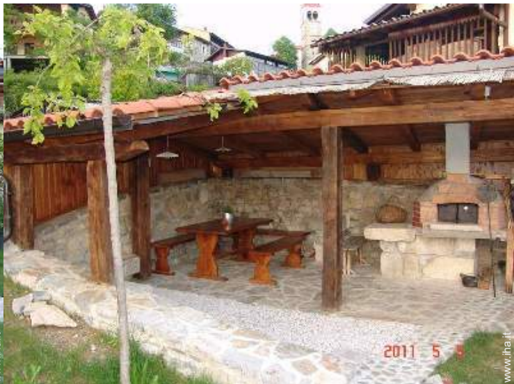
forno per pizze