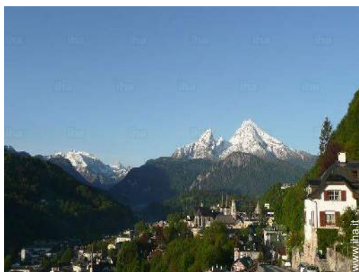
Città nelle vicinanze