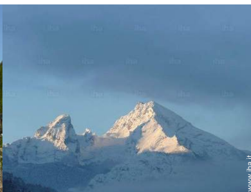
vista sulla montagna