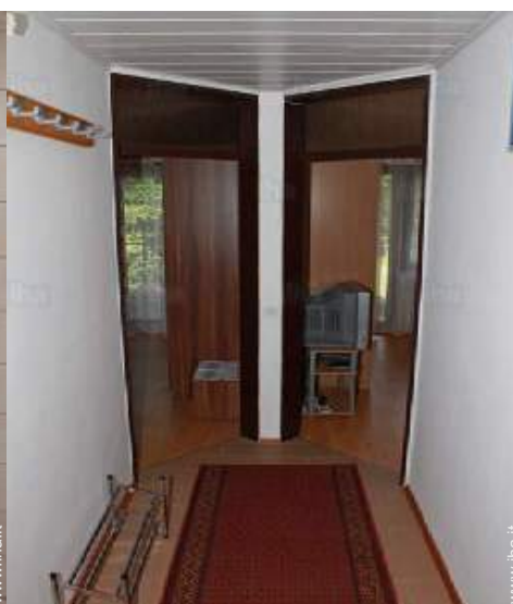
Disposizione interna e comfort