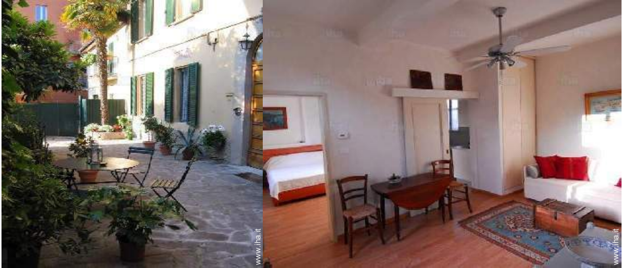
tavolo da giardino