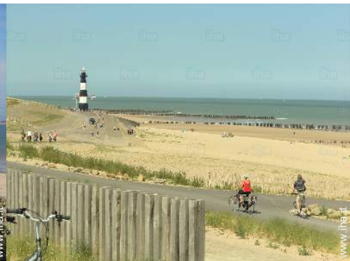
attività balneari nelle vicinanze