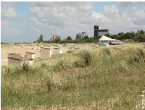
attività balneari nelle vicinanze