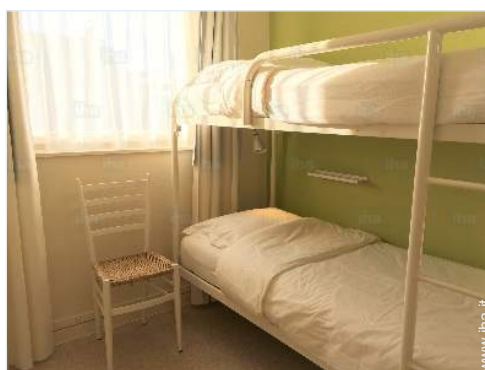
letti a castello