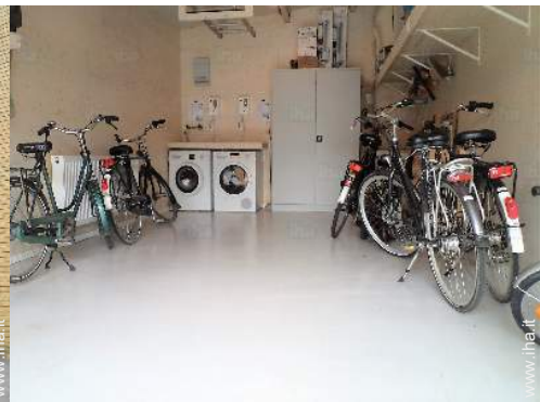
Attrezzature a disposizione