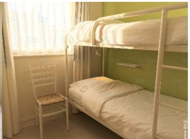
letti a castello