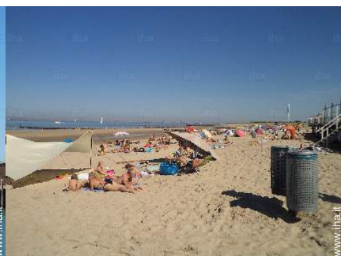
attività balneari nelle vicinanze