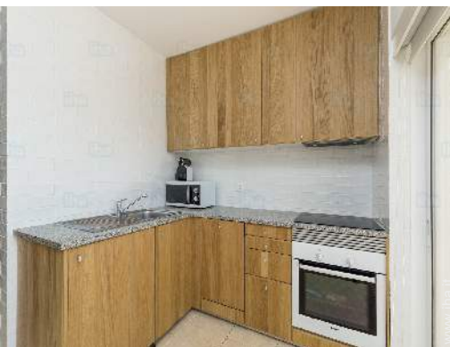
Comfort interno ed attrezzature