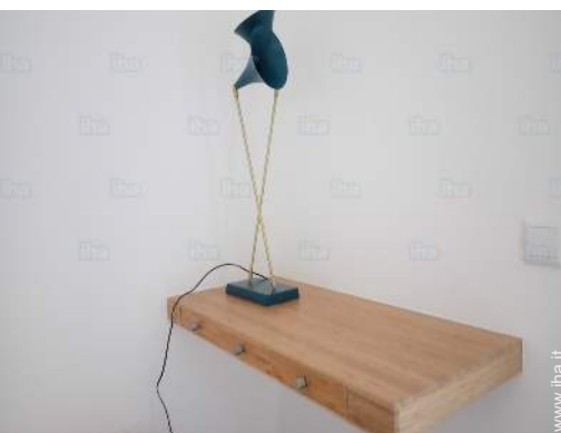
disposizione delle attrezzature ricreative