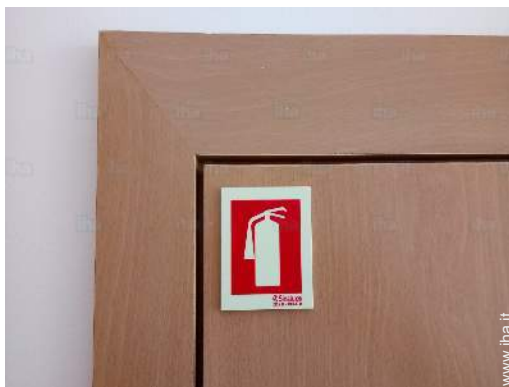
Attrezzature a disposizione