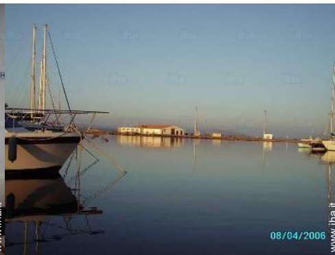
vista sul porto