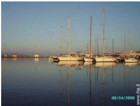
vista sul porto