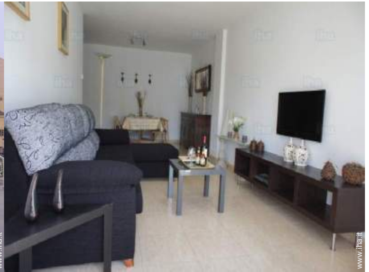
Disposizione interna e comfort