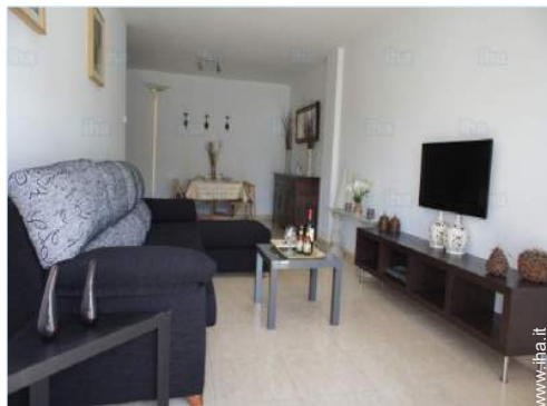
Disposizione interna e comfort