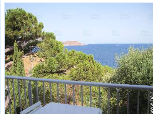
vista dal balcone