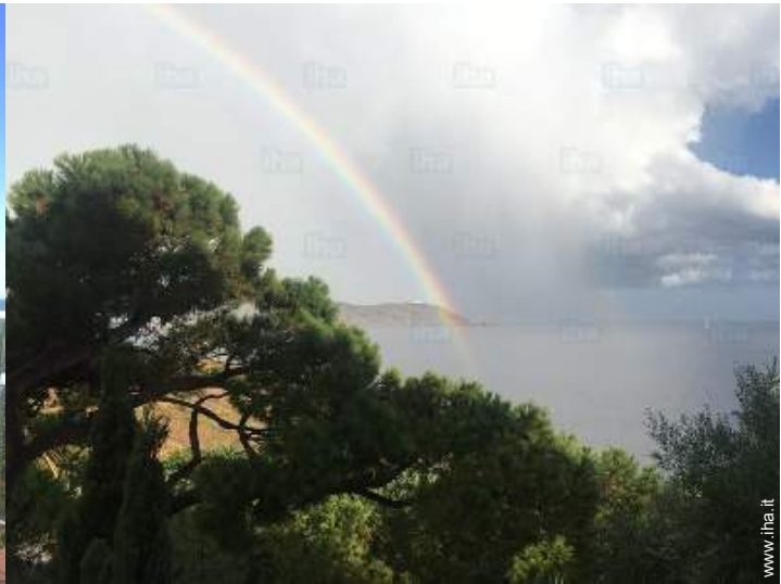
vista dal balcone