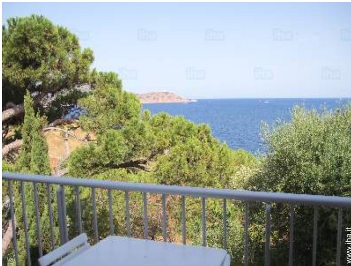
vista dal balcone