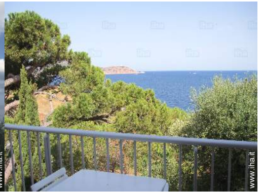
vista dal balcone