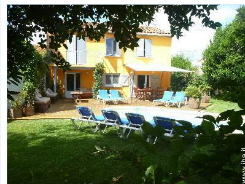
sedia(e) da giardino