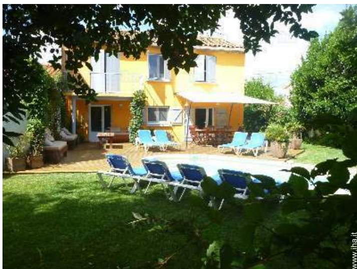
sedia(e) da giardino