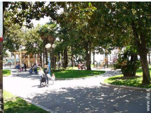
attività balneari nelle vicinanze