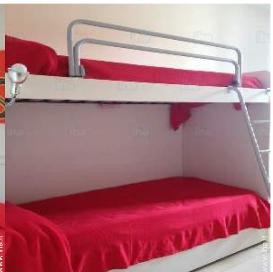
camera dei bambini