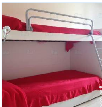
camera dei bambini