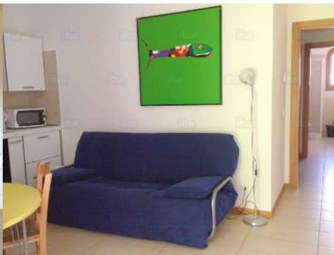
divano(i) letto 2 pers