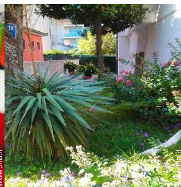
vista sul cortile