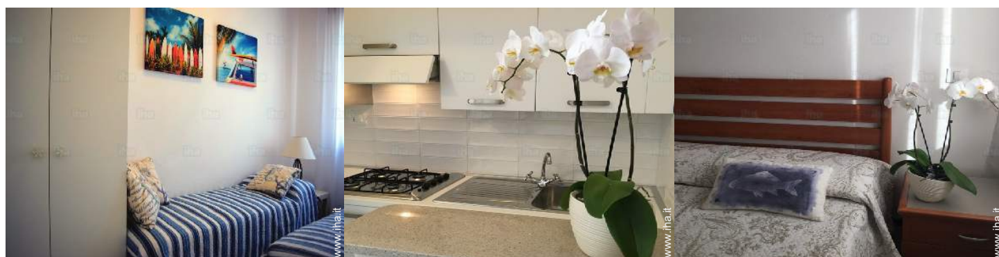
camera per ragazzi