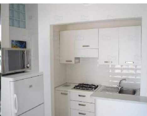
vista dalla cucina