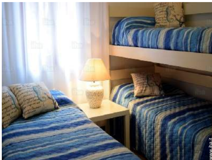
camera dei bambini