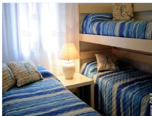
camera dei bambini