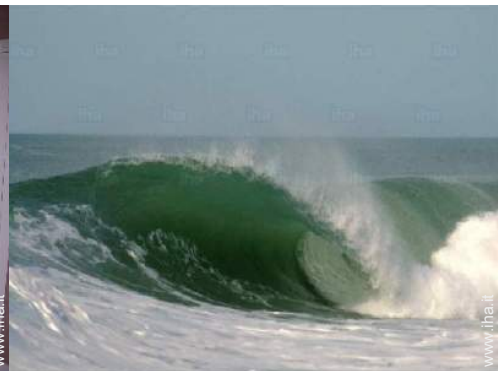
punto di surf