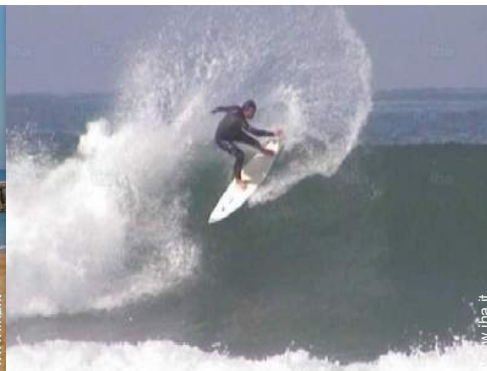
punto di surf