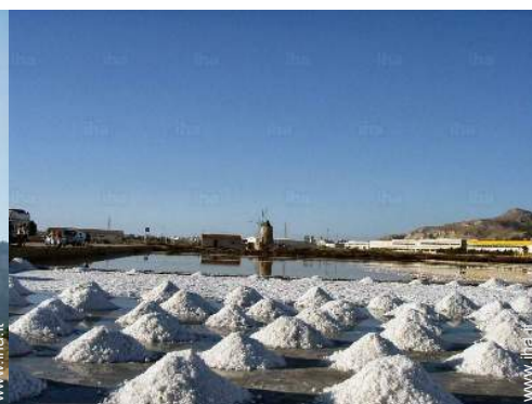
Città nelle vicinanze