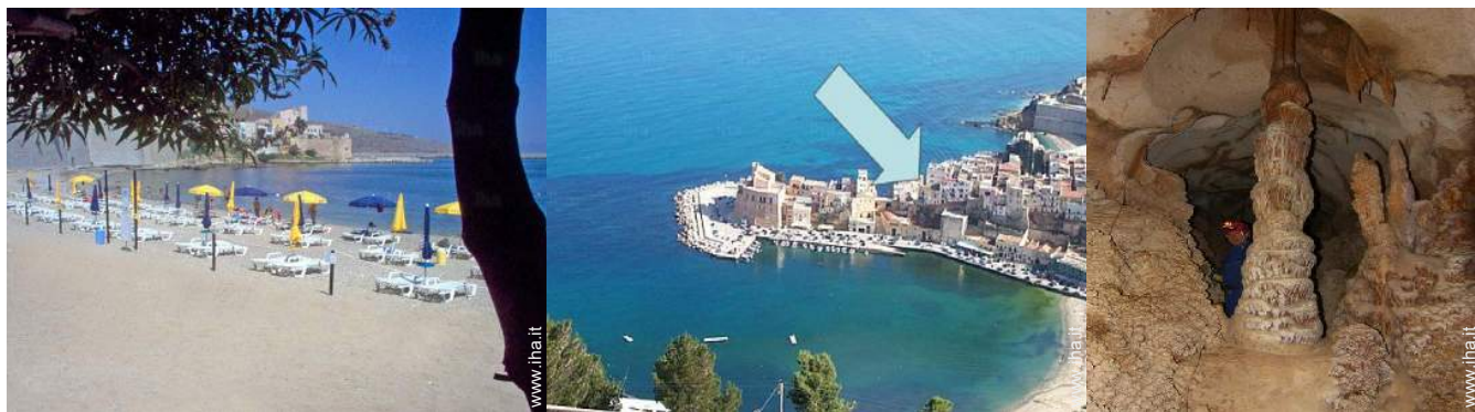
attività balneari nelle vicinanze