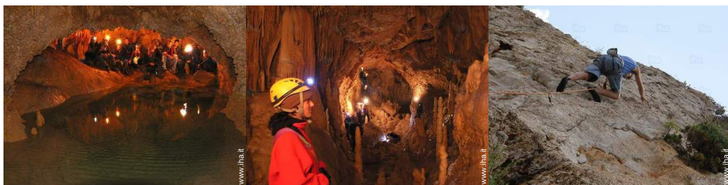
attività montane nelle vicinanze