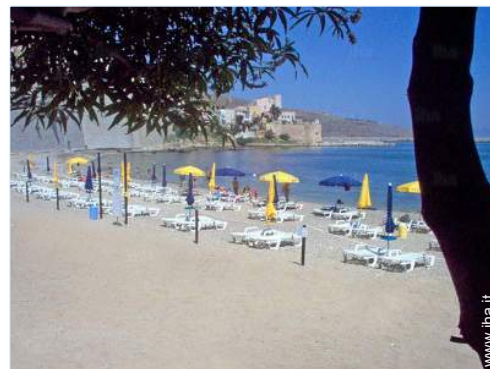
attività balneari nelle vicinanze