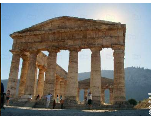
Città nelle vicinanze