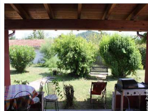
vista dal patio