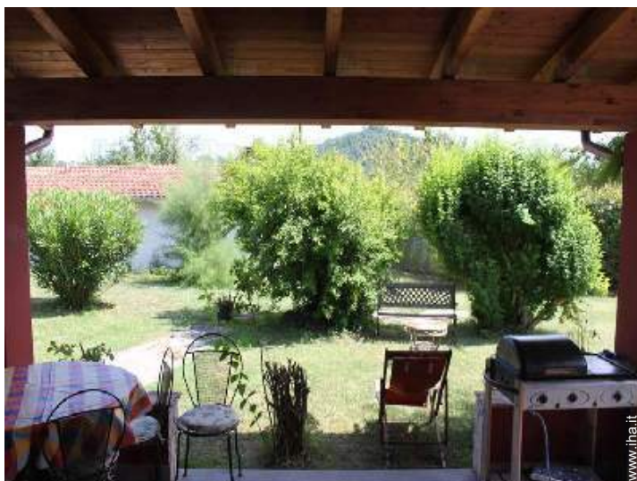
vista dal patio