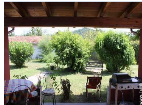
vista dal patio