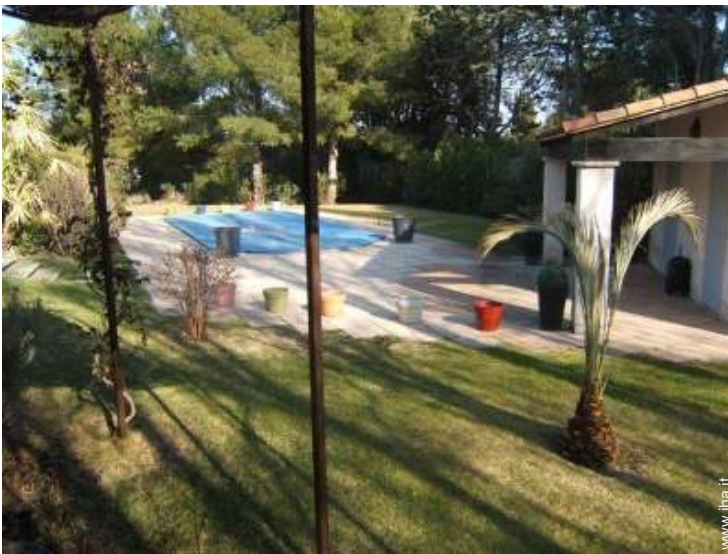
vista sulla piscina