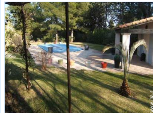
vista sulla piscina

Affitto materiale di immersione 10km Panetteria 2km Traiteur 2km Negozi tipici 2km Supermercato 2km Negozi di alta classe e di lusso 7,5km Salone di coiffure 2km Ufficio postale 2km Banca 2km Distributore automatico di biglietti 2km Farmacia 2km Medico 2km Infermiera 2km Ospedale 4km